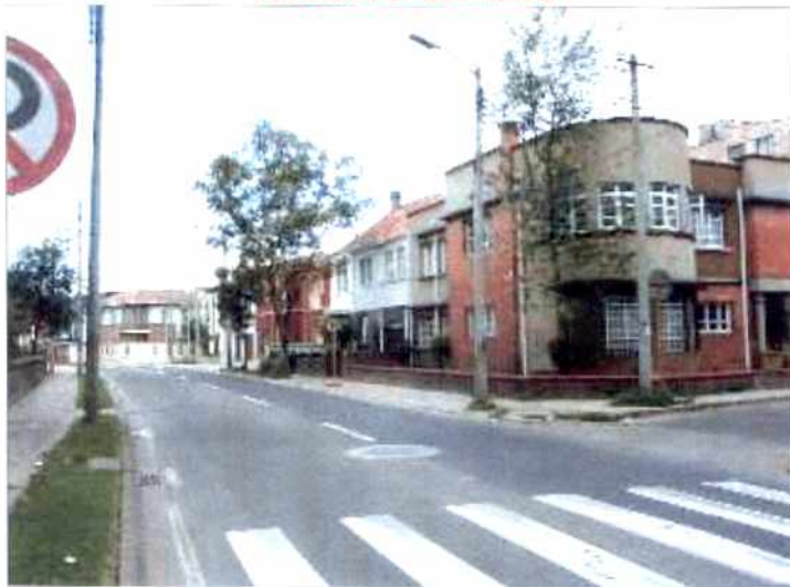
CRITERIOS DE CALIFICACION